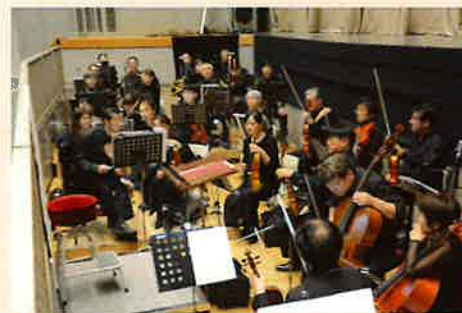
管弦楽：オペラ東京管弦楽団