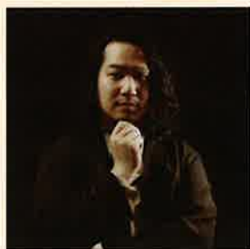
演出・構成 角 直之